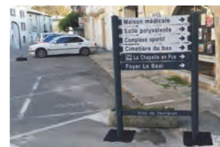
devenu l'ensemble No 8...