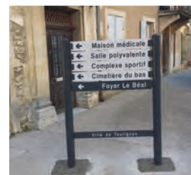
et l'ensemble No 9

Une signalétique plus adaptée au contexte