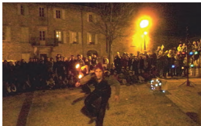
Beaucoup de monde pour la compagnie Soukha