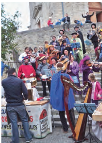
La musique a enchanté nos rues