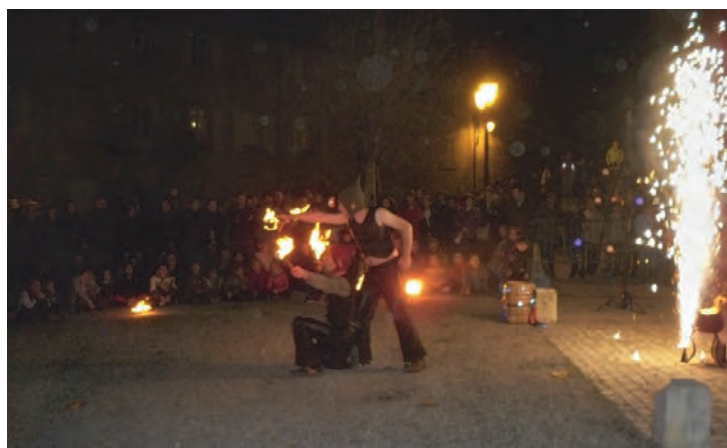
Une animation... explosive