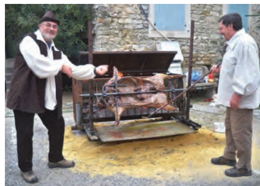
Des cuisiniers tout dévoués

Une fois de plus, le Marché de Noël a tenu ses promesses et répondu aux attentes du plus grand nombre. Des plaisirs simples et authentiques qui resteront gravés dans les esprits des plus jeunes. Beaucoup garderont ainsi une image positive de notre commune qui n'a pas uniquement des atouts touristiques en été mais qui sait aussi "recevoir" pendant la période hivernale.