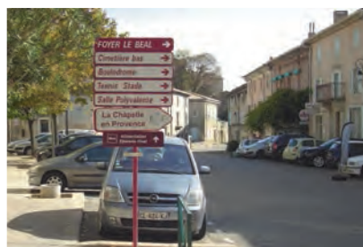
Ancien ensemble No 20...

L'équipe municipale en place, forte de son expérience de gestion des dossiers difficiles, a su faire preuve de patience , de ténacité , d' écoute afin d'obtenir un résultat concret où chaque partenaire pourra trouver satisfaction. Un cas d'école de la politique locale , qui se doit de répondre aux besoins spécifiques de chaque corporation tout en consultant, informant avec le devoir de respecter des contraintes impératives en matière de lois et de budget . Aboutir rapidement sur ce dossier était une volonté politique partagée par nos deux maires et leurs élus . Après une consultation exigeante où les entreprises sollicitées ont dû faire leurs preuves et s'engager à respecter des contraintes budgétaires nécessaires, le choix s'est porté sur la société Lacroix qui a su, grâce à son expertise en la matière, conduire et achever rapidement les travaux.